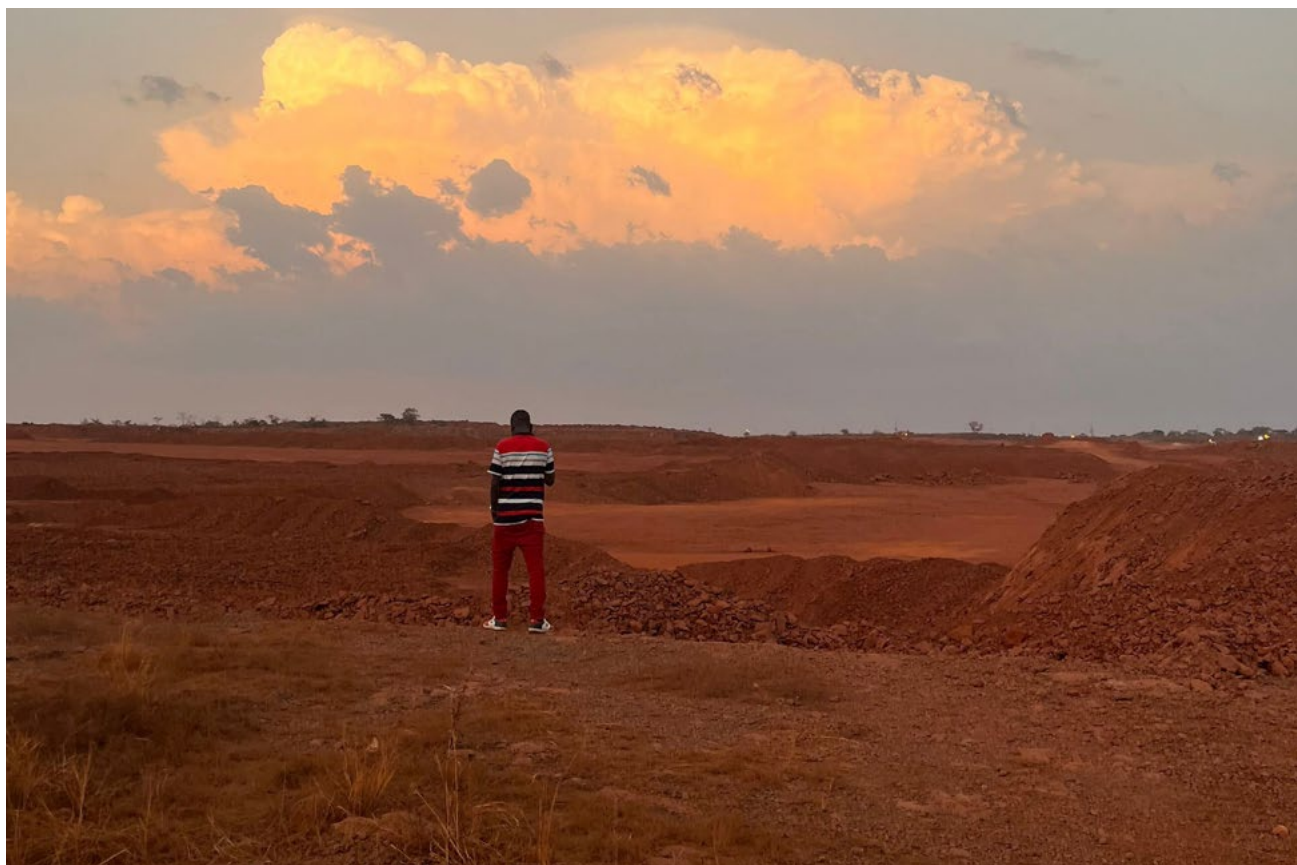
Mine de bauxite au sud du fleuve Cogon.

« Nous savons que la CBG veut tirer profit de nos terres. Mais nous devrions aussi en tirer parti. »