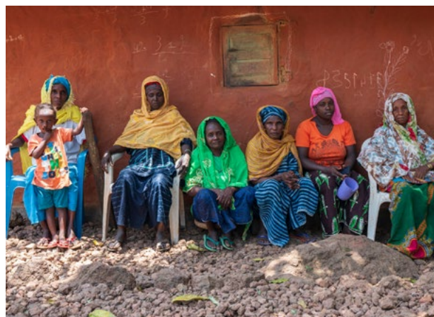
Des femmes se rassemblent dans un village au sud du fleuve Cogan.

Par ailleurs, de nombreuses multinationales qui utilisent la bauxite de la CBG dans leurs produits ont mis en place des normes en matière de droits humains et d'environnement que les entreprises de leur chaîne d'approvisionnement doivent respecter. Il s'agit notamment des constructeurs automobiles Mercedes-Benz, BMW, Audi, GM, Ford, Toyota et Porsche, qui fabriquent des véhicules électriques. Il s'agit également d'entreprises actives dans le domaine des énergies renouvelables, telles que Hellenic Cables, qui approvisionne des projets d'énergie verte, Bayards Aluminium Solutions, qui produit des pièces en aluminium pour les éoliennes, et METLEN, qui construit et développe des projets d'énergie propre.