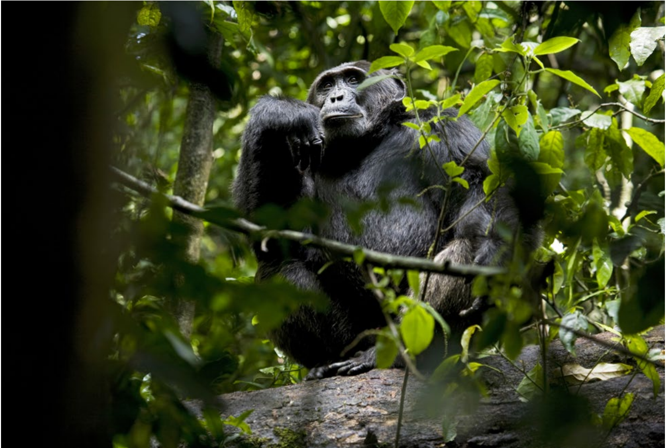
La Guinée abrite la plus grande population mondiale de chimpanzés de l'Ouest, une espèce en danger critique d'extinction, mais leurs habitats dans la région de Boké sont de plus en plus menacés par l'exploitation minière de la bauxite.

Comme de nombreux villages ruraux de Guinée, Teliwora manque d'électricité, d'installations sanitaires et d'une connexion Internet fiable, ce qui limite son développement économique. Mais la terre fournit suffisamment de nourriture et d'eau pour subvenir aux besoins de la population et maintenir un système social très soudé, comme c'est le cas depuis des générations.