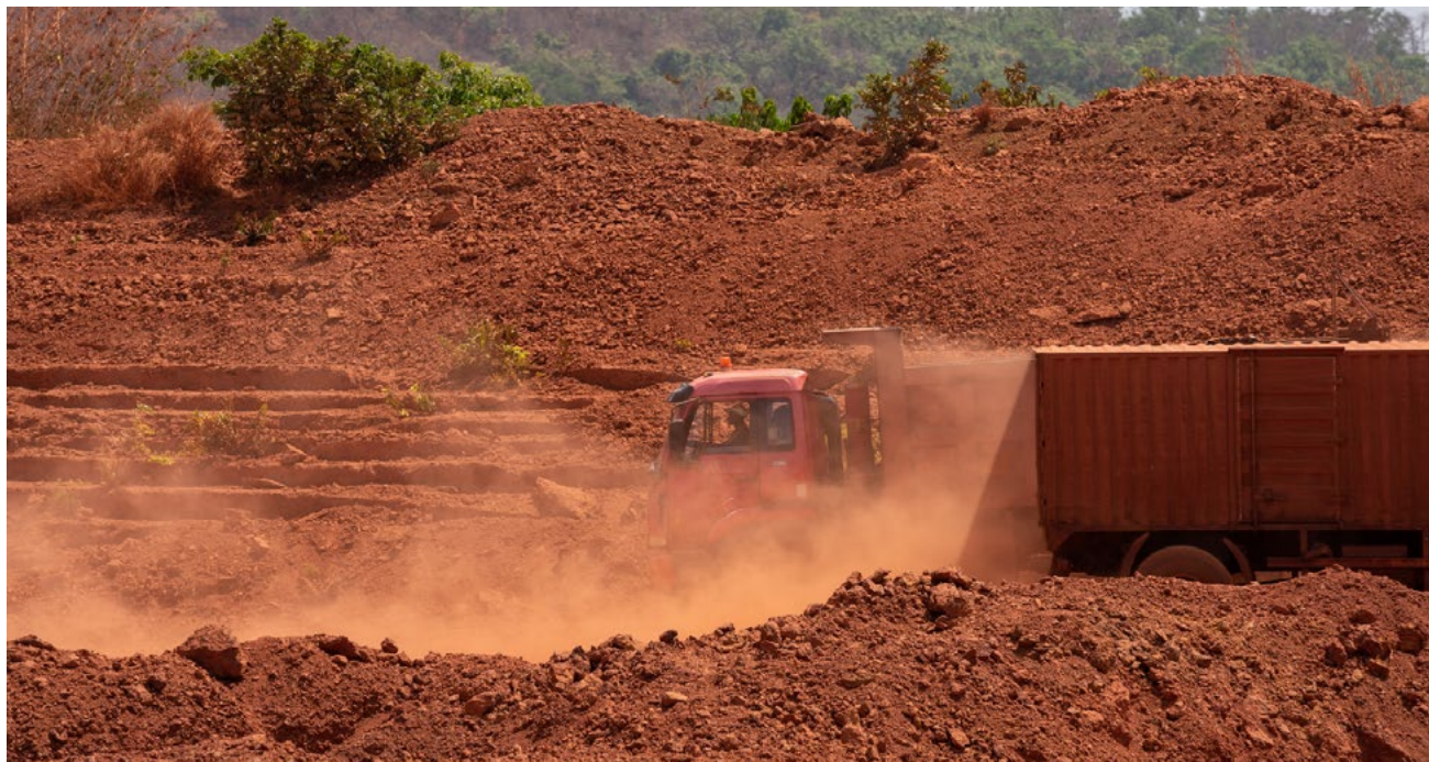
L'extraction de la bauxite.

Excédés et réclamant justice, les habitants de 13 villages ont déposé une plainte auprès de l'organisme de surveillance indépendant de la Société financière internationale, le Bureau de l'Ombudsman du conseiller en conformité (CAO), en 2019.