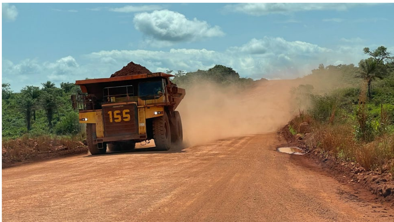
Camions transportant de la bauxite depuis le site minier.

Selon une analyse d'images satellites commandée par Inclusive Development International et portant sur les données entre 1974 et 2019, environ 10 % des terres exploitées par la CBG ont fait l'objet d'une forme de réhabilitation, ce qui est bien en deçà des bonnes pratiques du secteur. L'entreprise a ainsi laissé derrière elle de vastes zones mortes, inutilisables pour l'agriculture ou l'élevage, qui sont les principales activités économiques de la région. Les eaux de ruissellement provenant de l'exploitation à ciel ouvert polluent les rivières et les sources dont dépendent les populations, les cultures et le bétail pour s'approvisionner en eau.