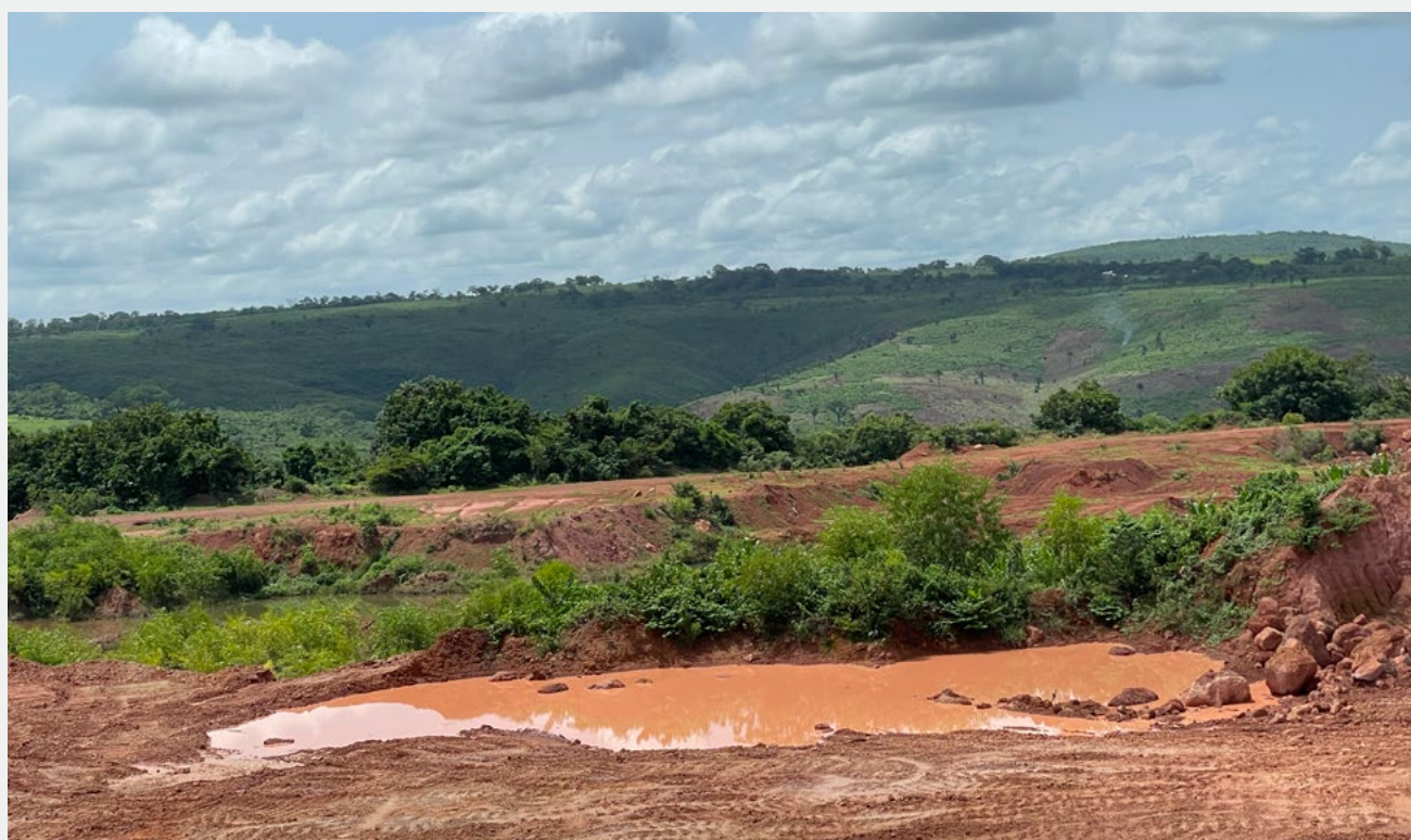
Ancien site minier au sud du fleuve Cogon.