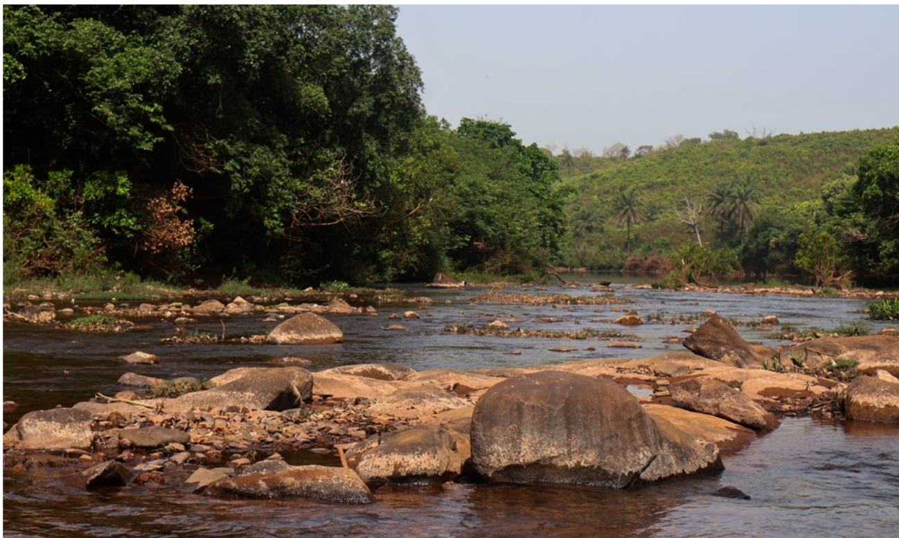
Le fleuve Cogon.

La bauxite, minéral servant à la fabrication de l'aluminium, est une source majeure de revenus pour la Guinée, pays d'Afrique de l'Ouest. Mais l'exploitation minière de la bauxite a déplacé et appauvri des milliers de personnes vivant à proximité des sites concernés. Alors que la plus ancienne entreprise minière de Guinée s'apprête à développer ses activités, stimulées par la croissance de la demande mondiale d'aluminium utilisé dans les voitures électriques, les panneaux solaires et les batteries, les communautés qui se trouvent sur son tracé réclament un accord plus équitable.